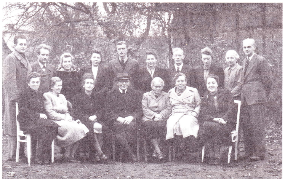
Das Lehrerkollegium im Jahre 1949: