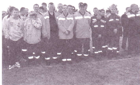
Die Jugendfeuerwehr Kirchdorf während der Eröffnung der Veranstaltung

Am 22. September 2007 fand auf dem Gelände des Inselhotels in Gollwitz der nunmehr zum 8. Mal geführte Wettkampf in der Disziplin „Löschangriff Nass“ statt. Pünktlich um 9.00 Uhr wurde die Veranstaltung durch den Ministerpräsidenten des Landes Mecklenburg-Vorpommern Dr. Harald Ringstorff (SPD) eröffnet. Auch der Bundesinnenminister Wolfgang Schäuble (CDU) hat die Veranstaltung mit einer Grußbotschaft gewürdigt.