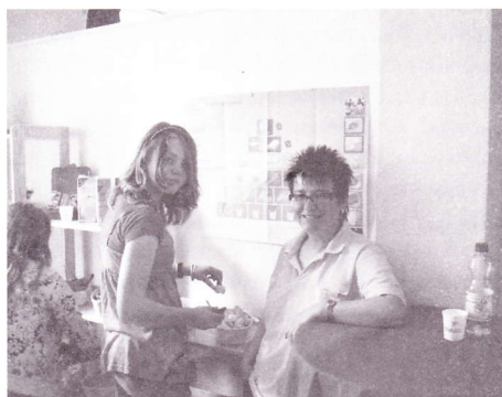
Verkostung und Ernährungsberatung