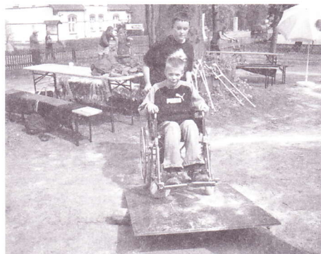
Schüler probieren den Handicap-Parcours

Die Auswertung zum Fotowettbewerb Oma/Opa Enkel führten wir zum Hoffest durch.