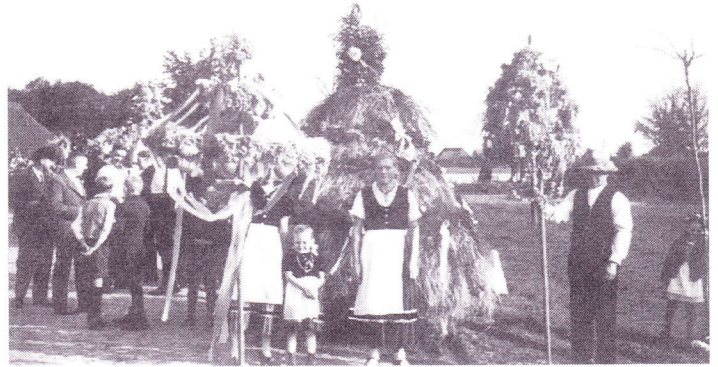
Auf diesem Foto aus den 30er Jahren vom Hellmann'schen Hof in Malchow sehen wir, daß man zur Ausschmückung des Festes sich sehr viel Mühe mit Erntekronen und bunten Bändern gab.