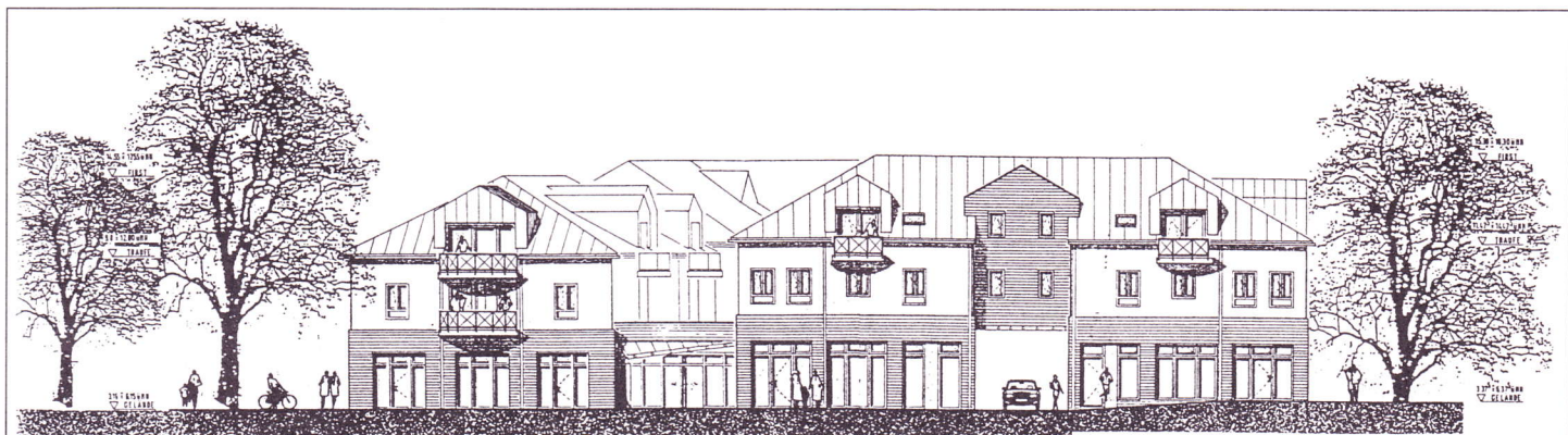
Westansicht (Wismarsche Straße) des künftigen Gemeindezentrums in Kirchdorf

Lesen Sie hierzu mehr in den kommenden Ausgaben.