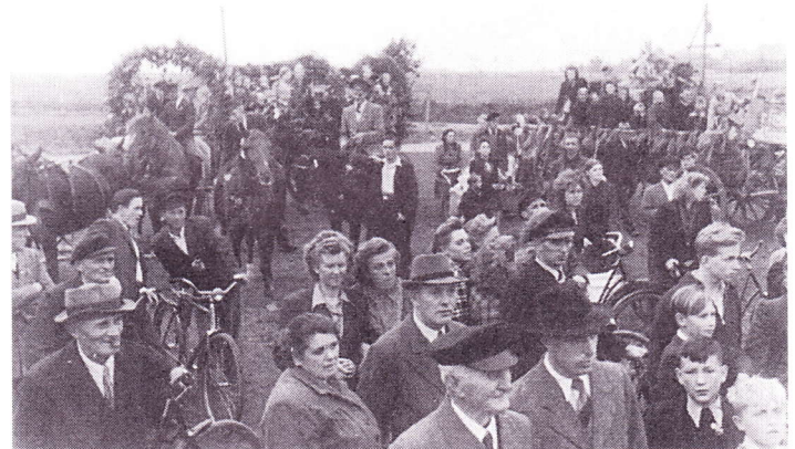
Erntefest an den Kirchwällen im Oktober 1951.