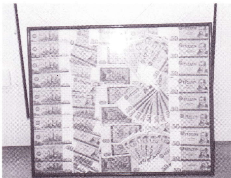
Nicht jeder nagelt sein Geld an die Wand.