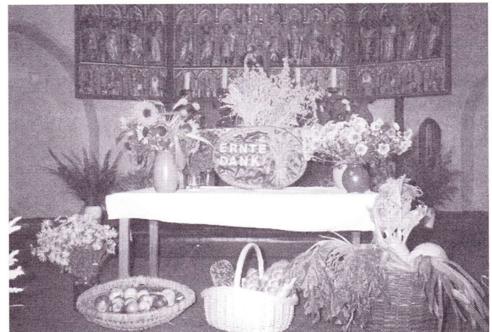
Dieser Tradition folgend gedenkt man auch heute noch jährlich diesem Fest, indem mit Früchten und einer Krone die Poeler Kirche während des Erntedank-Gottesdienstes wunderbar geschmückt wird.