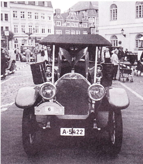
Das einzige noch erhalten gebliebene Auto der Podeus'schen Automobilabteilung, jetzt im Besitz eines norwegischen Museums.

1906 wartete man im Podeus'schen Unternehmen mit dem Aufbau einer Automobilabteilung auf, die sich sehr bald einen guten Namen machte, aber später während der Weltwirtschaftskrise geschlossen werden mußte.